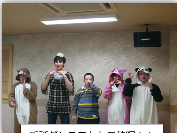
手話ダンスでトロ熱唱！！